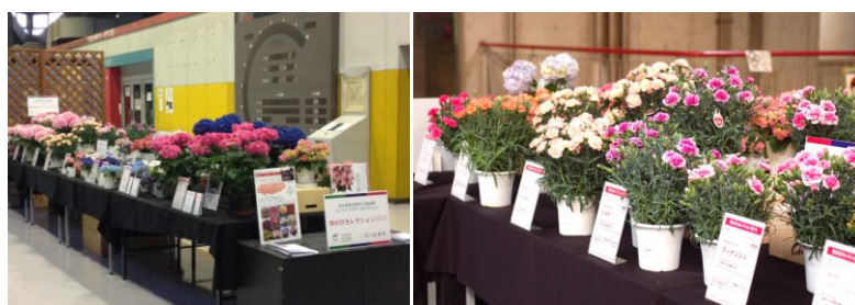
▲ 審査後の展示の様子