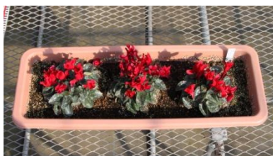
▲定植後約 30 日のコンテナ植え (ハウス内栽培) の様子 (11 月 9 日撮影)