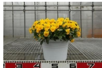
▲定植後約 150 日の 1 株植え (ハウス内栽培) の様子 (3 月 28 日撮影)