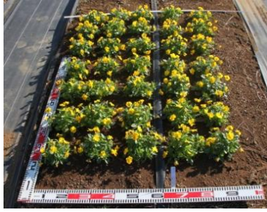
▲定植後約 8 日の路地花壇の様子 (11 月 9 日撮影)