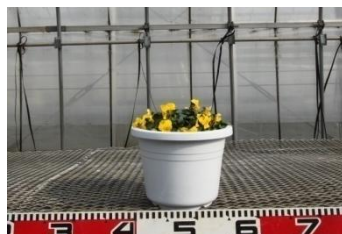
▲定植後約 70 日の 1 株植え (ハウス内栽培) の様子 (1 月 9 日撮影)