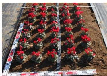
▲定植後 30 日の路地花壇の群落植栽の様子 (11 月 9 日撮影)

■シクラメン「4013 メティス®ブライトレッドコンパクトエボリューション」は、非常に明るい赤色で、濃い緑色の葉とのコントラストが美しいミニシクラメン。花上がりが良く、葉の大きさもよくそろっている。下の画像のように植え込み後から 100 日ほど経過しても株張りがほとんど変わらず、草姿が丸くコンパクトに整っているため、寄せ植えなどの素材として形が崩れずに長く楽しめる。露地花壇では 10 月 11 日に定植し約 2 ヶ月後の 12 月中旬までは楽しめた。また屋根付き施設内では栽培したすべての株について病気にならず定植から約 100 日以上継続して花を咲かせた。シクラメンは咲き終わった花ガラをこまめに摘み取ることが管理の基本であるが、花卉の傷みが目立たない色味であることから、あまり手がかけられない場合でも目立ちにくい。