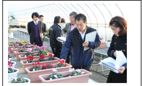
写真上 路地花壇での審査の様子