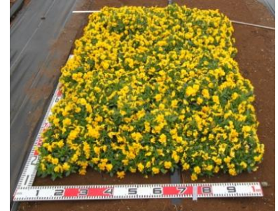
▲定植後約 147 日の路地花壇の様子 (3 月 28 日撮影)