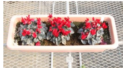
▲定植後約 120 日のコンテナ植え (ハウス内栽培) の様子 (2 月 7 日撮影)

■ビオラ「ソルベ XP イエロー」はくすみのない鮮やかな黄色の花色。低温・短日期にも生長を続け、連続開花していた。株張りが良く花数も豊富で、1 株で鉢植えにしたものは全体にこんもりと花が付き、株がきれいな形に整った。横這い性があり鉢から少し垂れ下がるように広がるので、目線から少し高い位置に置いても楽しめる。ハンギングバスケットなどへの利用の提案もできるだろう。株張りが旺盛なため、株間は少し広めにとることで、路地花壇での群落植栽の場合は株ごとの凹凸が出にくくなる。丈夫で病害虫もつきにくく、消費者に安心してすすめられる品種である。