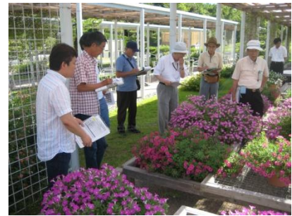
【第2回審査会の様子 10/5】

日時：（第1回）2010年8月4日（水）13:40～17:00 （第2回）2010年10月5日（火） 〃 場所：浜名湖ガーデンパーク（静岡県浜松市） （現地審査）ジャパンフラワーセレクション審査用花壇 （全体協議）体験学習館2F 会議室