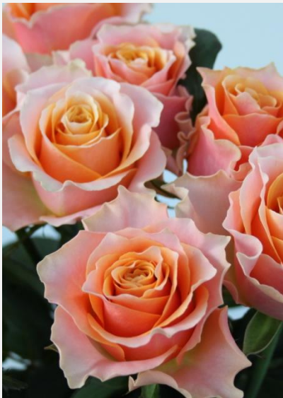
品目名：バラ 品種名：カルピディーム+ 受賞者：國枝バラ園