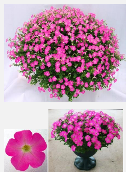
品目名：ペチュニア 品種名：マドンナの宝石 ピンク （マウントプッチ ピンク） 受賞者：有限会社 村岡オーガニック