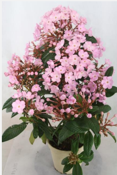
品目名：ルクリア 品種名：ココ 受賞者：株式会社 登坂園芸