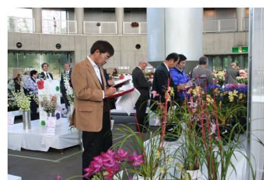
【「JFF in かがわ」での審査風景】